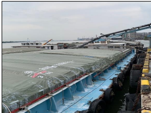
ภาพที่ 3 ผ้าใบปิดคลุมเรือขนส่งอย่างปิดชิด