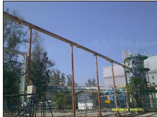
ภาพที่ 2 ระบบท่อลำเลียงแบบปิด