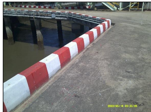
ภาพที่ 5 รางระบายน้ำบริเวณท่าเทียบเรือ