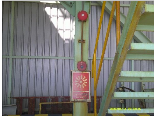
ภาพที่ 16 สัญญาณเตือนภัย บริเวณท่าเทียบเรือ