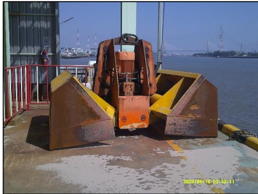
ภาพที่ 1 การจัดให้มีกระเช้าขึ้นจั่น