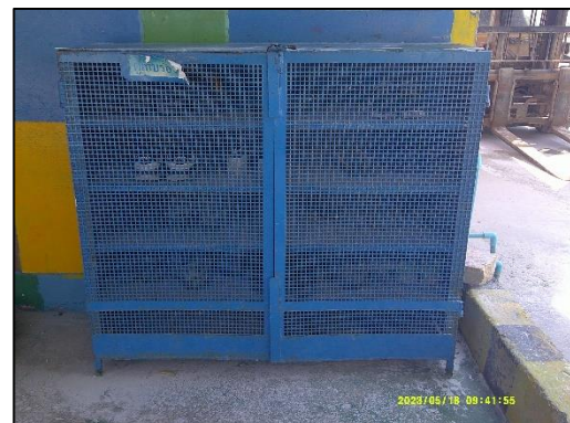
ภาพที่ 15 ตู้เก็บอุปกรณ์ป้องกันอันตรายส่วนบุคคล