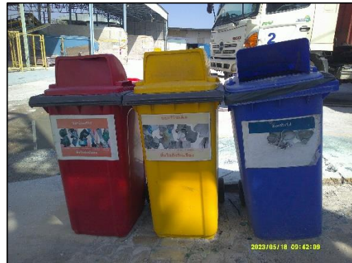
ภาพที่ 4 ถังรองรับมูลฝอยแบบแยกประเภท