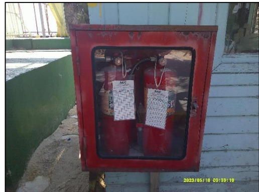
ภาพที่ 17 การจัดเตรียมถังดับเพลิง บริเวณท่าเทียบเรือ